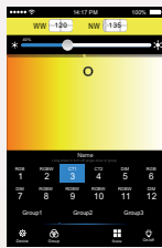
Contrôle de température de blancs RGB+W